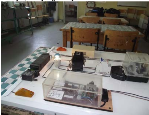
Spații de pregătire practică